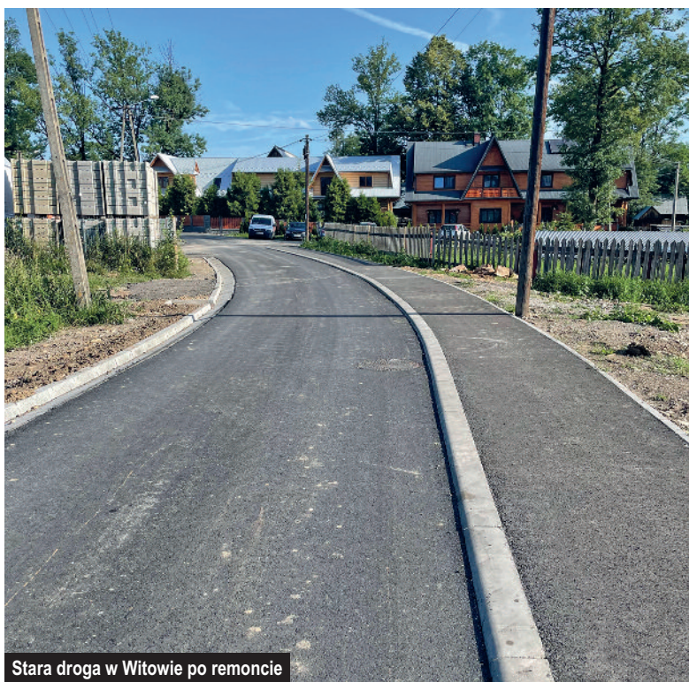
Stara droga w Witowie po remoncie