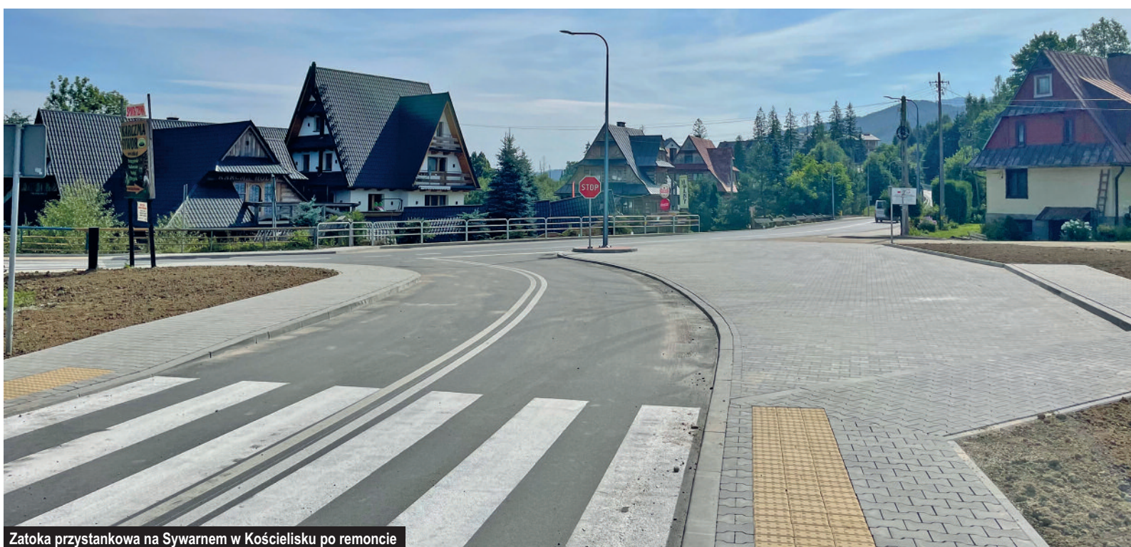
Zatoka przystankowa na Sywarnem w Kościelisku po remoncie