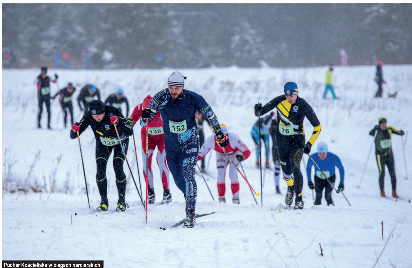
Puchar Kościeliska w biegach narciarskich

W roku 2021 gmina organizowała, współorganizowała lub finansowała takie imprezy sportowe jak VIII Puchar Kościeliska w biegach narciarskich, Tatrzański Festiwal Biegowy Tatra Sky Marathon, Bieg Walentynkowy w Kościelisku, Bieg Rodzinny w Witowie, Puchar Witowa w narciarstwie zjazdowym, Festiwal Moc Gór oraz Mistrzostwa Polski w Biathlonie Słabowidzących.