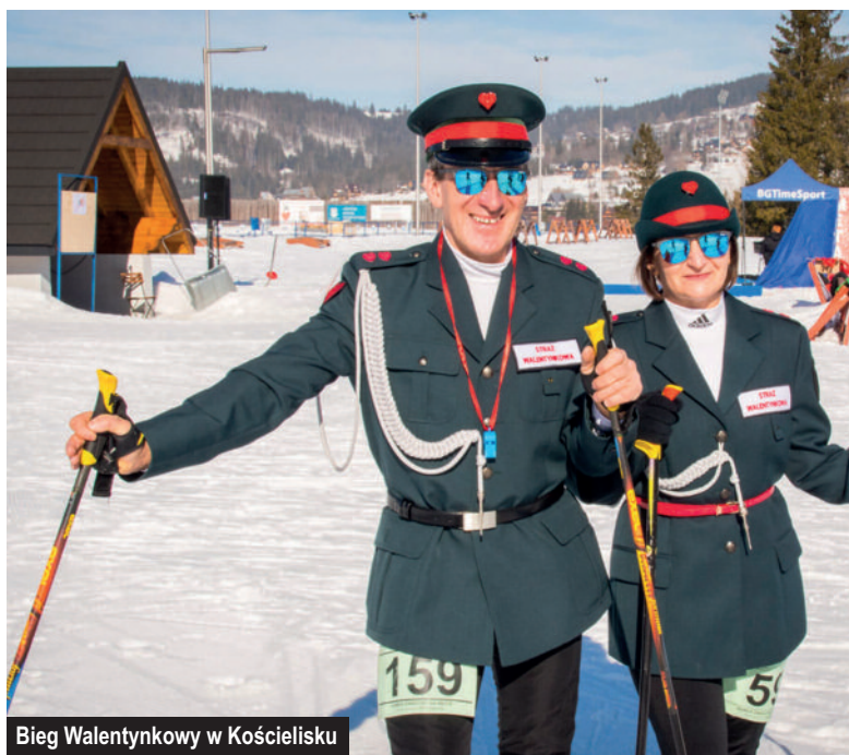
Bieg Walentynkowy w Kościelisku

Na podstawie Uchwały Rady Gminy Kościelisko nr XXX/224/17 z 10 sierpnia 2017 r. w sprawie ustanowienia stypendiów sportowych dla osób fizycznych za osiągnięte wyniki sportowe, zasad oraz trybu ich przyznawania i pozabawiania, Wójt Gminy Kościelisko corocznie przyznaje stypendia za osiągnięcia sportowe. Stypendia przyznawane są na dany rok szkolny, na okres 10 mie-