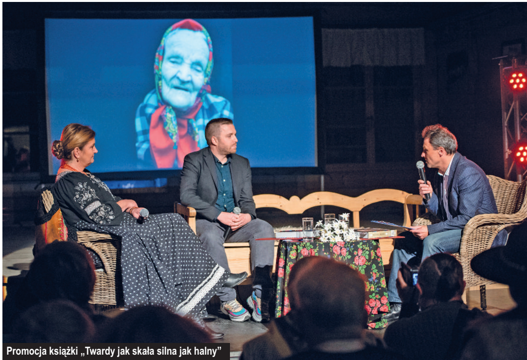
Promocja książki „Twardy jak skała silna jak halny”

Dyrektor GOKR jest przedstawicielem gminy w Radzie Programowej Tatrzańskiej Agencji Rozwoju Promocji i Kultury, Kapitulie Marki Tatrzańskiej oraz Komitecie Organizacyjnym Tatrzańskich Wici.