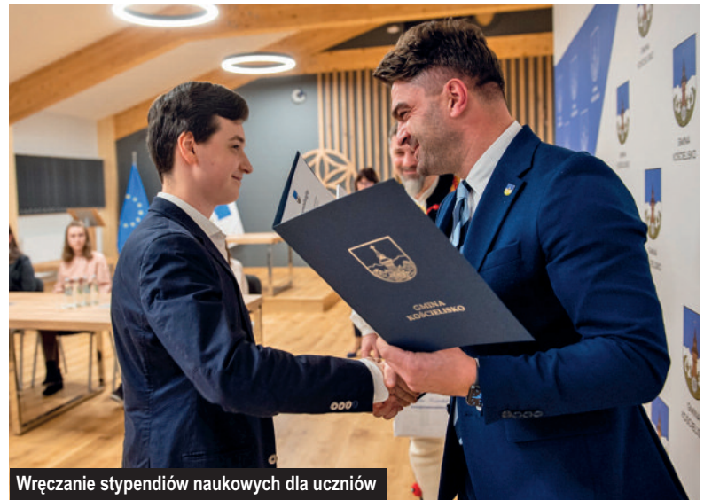
Wręczenie stypendiów naukowych dla uczniów

Uczniowie z gminy Kościelisko w 2021 r. po raz kolejny brali udział w projekcie koordynowanym przez Urząd Marszałkowski Województwa Małopolskiego pn.: „Małopolskie Talenty – Małopolskie Talenty-I, II etap edukacyjny”, którego realizatorem jest Stowarzyszenie Rozwoju Podtatrz. W każdej edycji zajęcia prowadzone są w wymiarze 60 godzin (zajęcia przedmiotowe) oraz 20 godzin (zajęcia ponadprzedmiotowe).