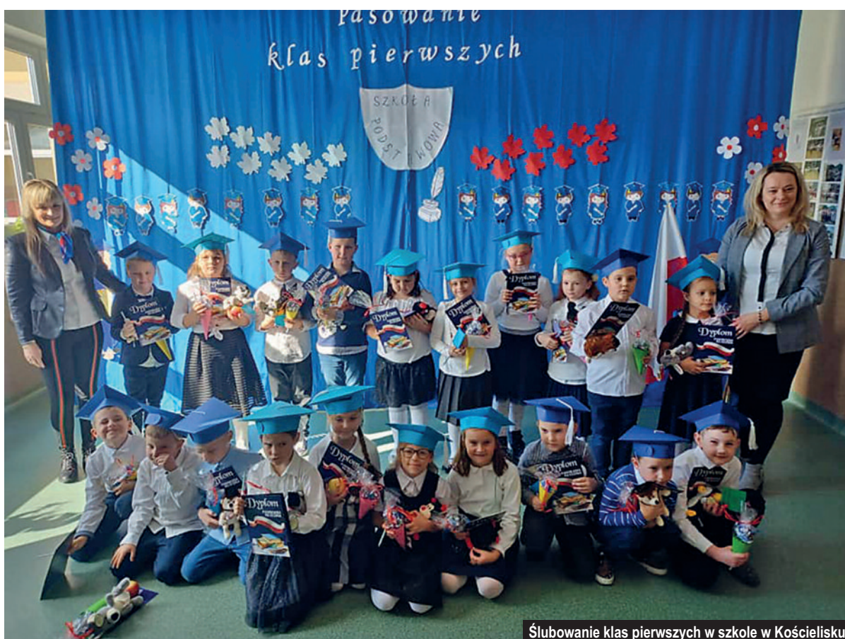
Ślubowanie klas pierwszych w szkole w Kościelisku

Na zakup książek i realizację działań promujących czytelnictwo wydano 3 750,00 zł.