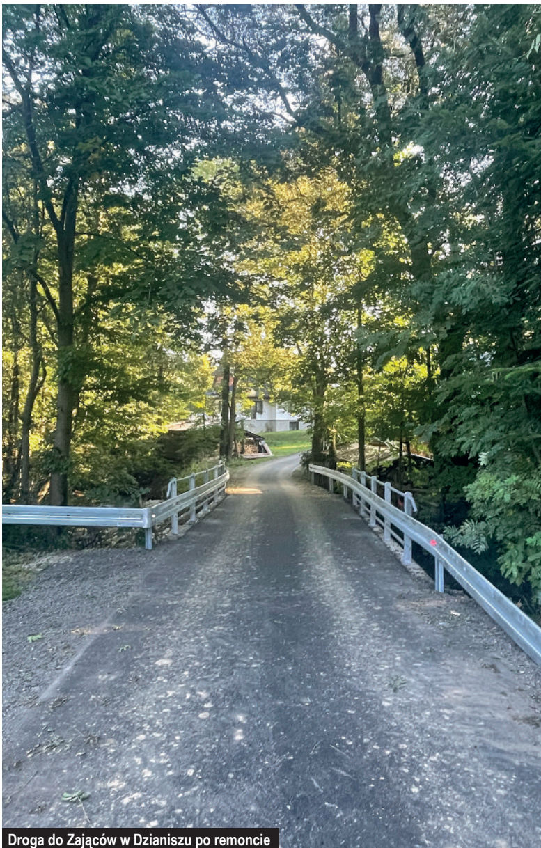
Droga do Zająców w Dzianiszu po remoncie

Aby móc realizować powyższe inwestycje niezbędne są środki finansowe, zewnętrzne dofinansowanie. Rok 2021 był pod tym względem dla naszego samorządu bardzo dobry.