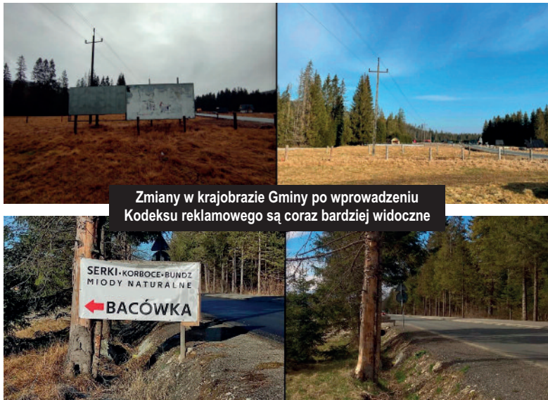
Zmiany w krajobrazie Gminy po wprowadzeniu Kodeksu reklamowego są coraz bardziej widoczne

Od 2019 roku na terenie gminy Kościelisko obowiązuje uchwała Nr VI/50/19 Rady Gminy Kościelisko z 23 maja 2019 roku w sprawie zasad i warunków sytuowania obiektów małej architektury, tablic reklamowych i urządzeń reklamowych oraz ogrodzeń na terenie gminy Kościelisko, która została podjęta w trosce o zachowanie piękna krajobrazu i ma na celu uporządkowanie przestrzeni wspólnej.