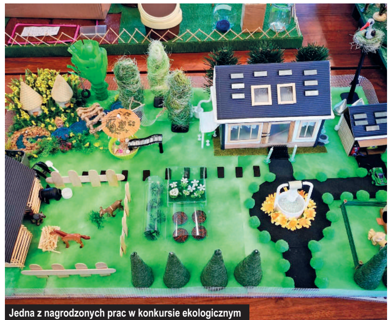
Jedna z nagrodzonych prac w konkursie ekologicznym

https://www.gminakoscielisko.pl/pl/dla-mieszkanca/aktualnosci/raport-o-stanie-gminy-w-roku-2021