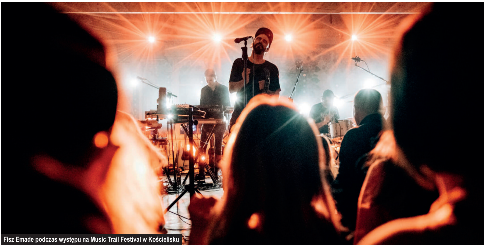
Fisz Emade podczas występu na Music Trail Festival w Kościelisku

Z końcem roku zakończono również współpracę z Lokalną Organizacją Turystyczną Gminy Kościelisko w kwestii prowadzenia Centrum Informacji Turystycznej.