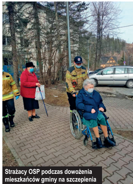
Strażacy OSP podczas dowożenia mieszkańców gminy na szczepienia

Najważniejsze akcje strażaków z terenu naszej gminy to m.in. w lutym – pożar budynku w Zakopanem przy ul. Jagiellońskiej oraz pożar domku letniskowego w Kościelisku przy ul. Polana Pająkówka, w marcu – pożar budynku w Zakopanem przy ul. Sienkiewicza, w czerwcu – ogromny pożar w Nowej Białej – spaliło się 67 budynków mieszkalnych i gospodarczych (był to największy pożar w Polsce w 2021 r.), w lipcu – strażacy interweniowali podczas intensywnych opadów deszczu, które spowodowały zalanie budynków w Kościelisku i podmycie drogi na terenie Witowa i Dzianisza, we wrześniu – pożar w Kościelisku, przy ul. Karpelówka, w październiku w – Witowie miała miejsce akcja reanimacyjna mężczyzny w zastępstwie