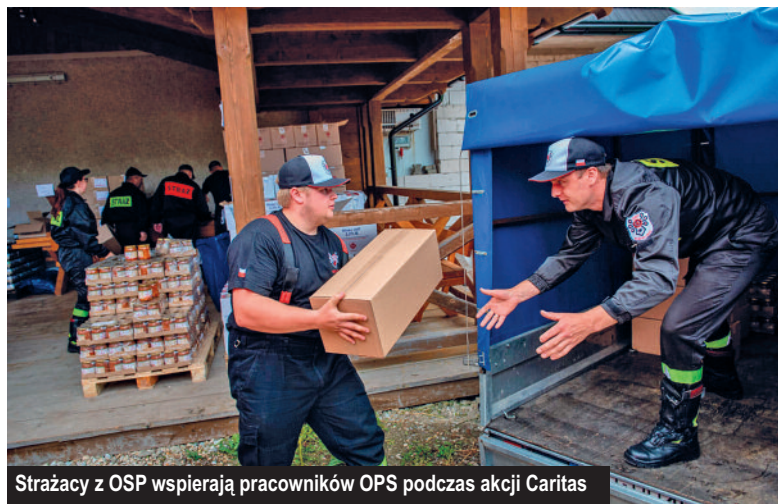
Strażacy z OSP wspierają pracowników OPS podczas akcji Caritas