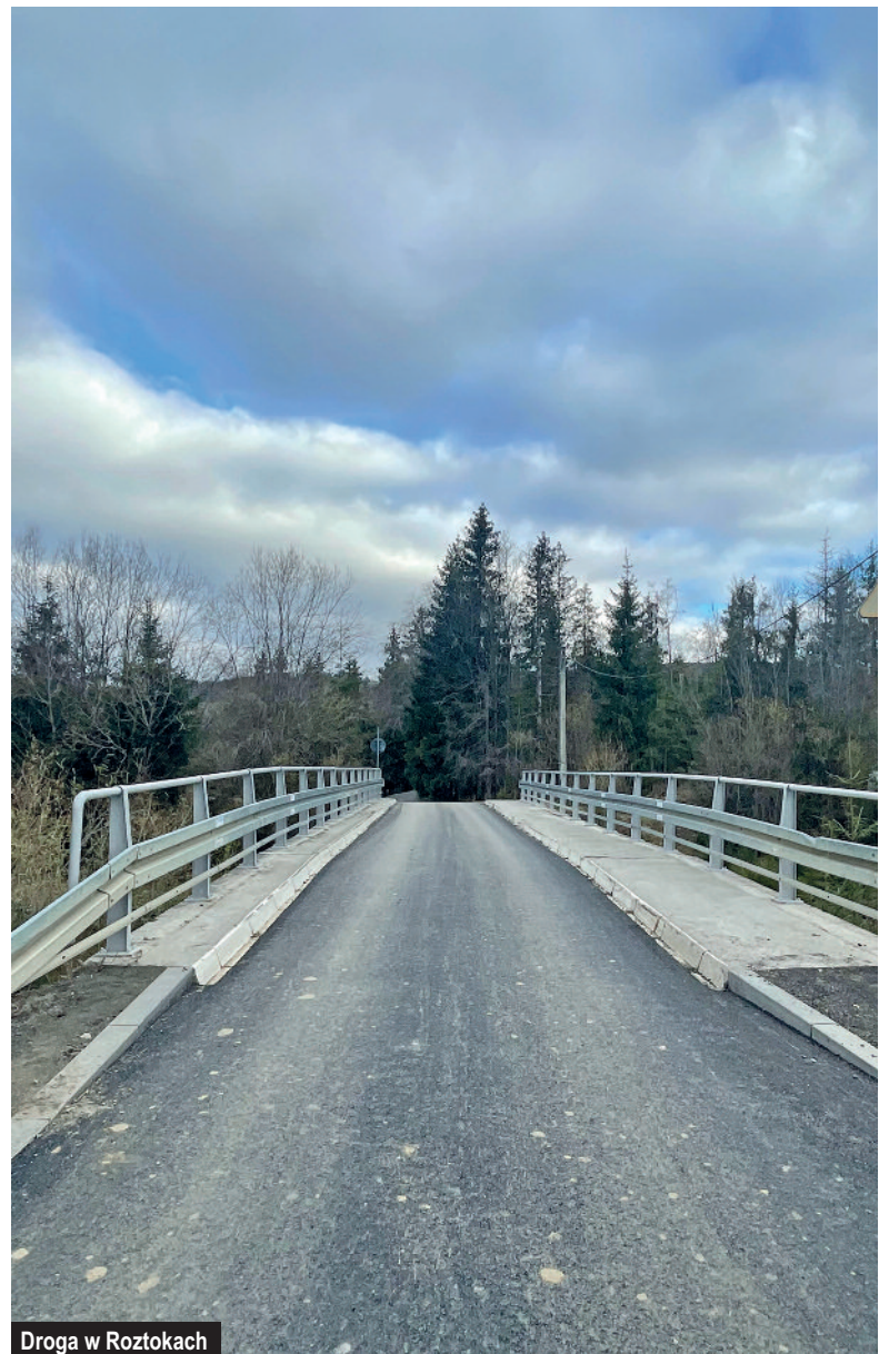
Droga w Roztokach