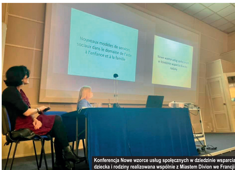
Konferencja Nowe wzorce usług społecznych w dziedzinie wsparcia dziecka i rodziny realizowana wspólnie z Miastem Divion we Francji

Efektorem bliskich kontaktów z Divion było ogromne wsparcie z pomocą dla uchodźców z Ukrainy, jakie nasza gmina otrzymała i nadal otrzymuje w roku 2022.