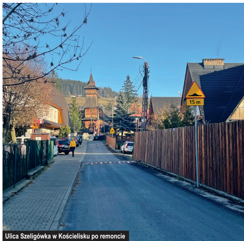
Ulica Szeligówka w Kościelisku po remoncie