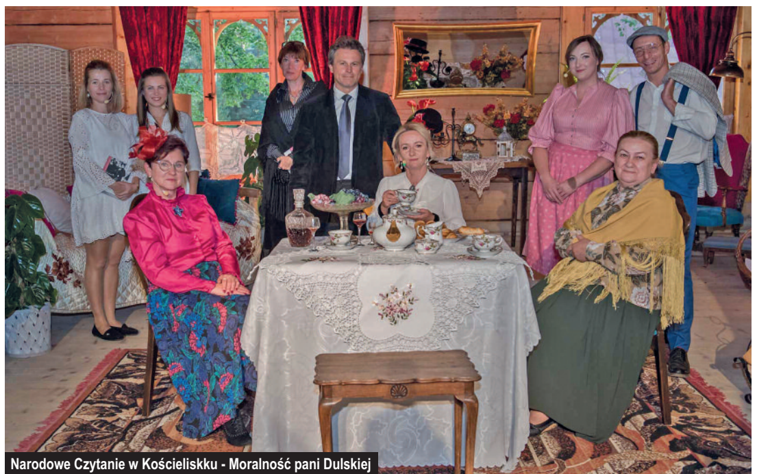
Narodowe Czytanie w Kościelisku - Moralność pani Dulskiej

Katalog biblioteki na dzień 31.12.2021 roku liczy ponad 25 tys. woluminów. W minionym roku zostało wypożyczonych i udostępnionych łącznie ponad 17 tys. książek, publikacji i czasopism na miejscu i na zewnątrz. Posiadamy również elektroniczny dostęp do platformy Ibuk Libra oraz platformy Legimi umożliwiającą dostęp do kilkunastu tysięcy publikacji.