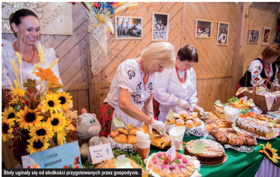
Stoły uginały się od słodkości przygotowanych przez gospodynie.

Rąbanica Bacy, Góralskie SPA, Diabelska Rozkosz, Zimny Drań i Letni Sztyniak pod Pierzynką. To tylko niektóre z prawie siedemdziesięciu ciast, które przygotowały podhalańskie gaździny na V Konkurs Ciast „Góralskie Słodkości” w Kościelisku.