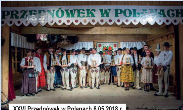
XXVI Przednówek w Polanach 6.05.2018 r.