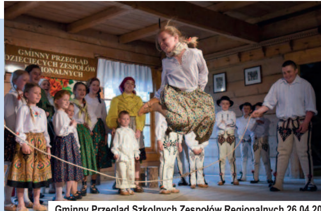
Gminny Przegląd Szkolnych Zespołów Regionalnych 26.04.2018 r.