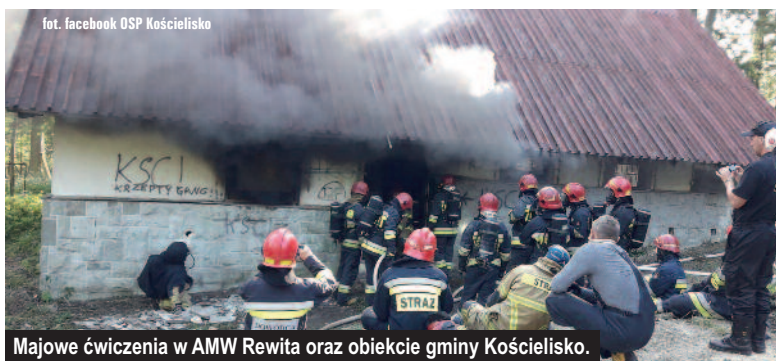
Majowe ćwiczenia w AMW Rewita oraz obiekcie gminy Kościelisko.

24 maja odbyły się zorganizowane przez Komendę Powiatową Państwowej Straży Pożarnej Zakopane oraz Komendę Wojewódzką PSP Kraków ćwiczenia, których celem było ugaszenie pożaru lasu oraz budowanie punktów czerpania wody i dostarczanie jej na długich odcinkach. W ćwiczeniach brały udział wszystkie jednostki OSP z Krajowego Systemu Ratownictwa Gaśniczego z Powiatu Tatrzańskiego oraz jedna jednostka spoza tj. OSP Dzianisz Dolny, a także zastępy z PSP Powiatu Tatrzańskiego, Nowotarskiego i Suskiego. Z naszej jednostki na ćwiczenia udały się zastępy: GCBART Scania, GLM Ford Ranger oraz Quad. W ćwiczeniach bra-