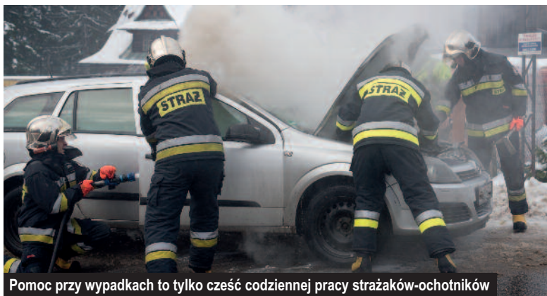
Pomoc przy wypadkach to tylko część codziennej pracy strażaków-ochotników

W miesiącach od kwietnia do listopada zostały zamontowane lub zmodernizowane hydranty na terenie gminy Kościelisko, powstał zbiornik przeciwpożarowy w Dzianiszu Górnym na osiedlu Malce, wyczyszczono i odmulono zbiornik przeciwpożarowy w Dzia-