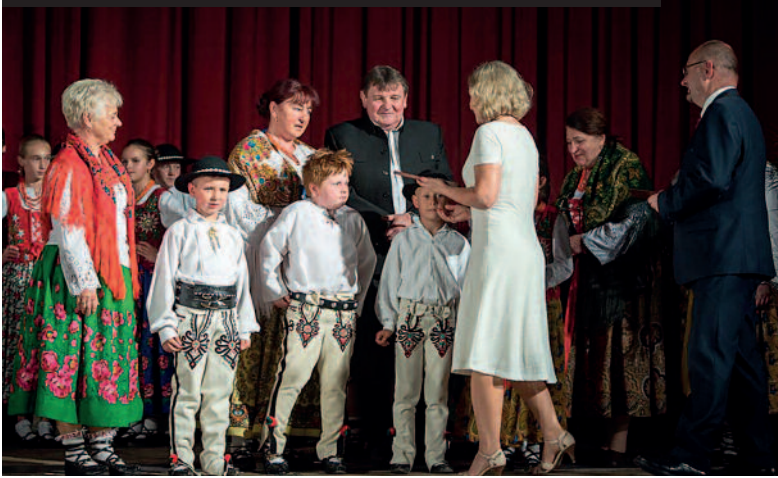
Zespół Polany podczas dekoracji Odznaką Zasłużony dla Kultury Polskiej.

Drugi kwartał roku 2018 to czas obfity we wszelkiego rodzaju nagrody i wyróżnienia, jakie przypadły w udziale mieszkańcom gminy Kościelisko. Były to nagrody z zakresu kultury, działalności rolniczej, społecznej i gospodarczej.