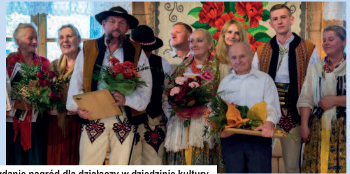
Rozdanie nagród dla działaczy w dziedzinie kultury i promocji z Gminy Kościelisko 11.05.2018 r.