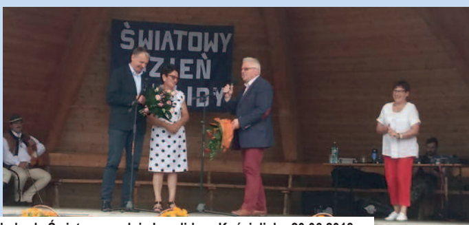
Obchody Świątowego dnia Inwalidy w Kościelisku 20.06.2018 r.