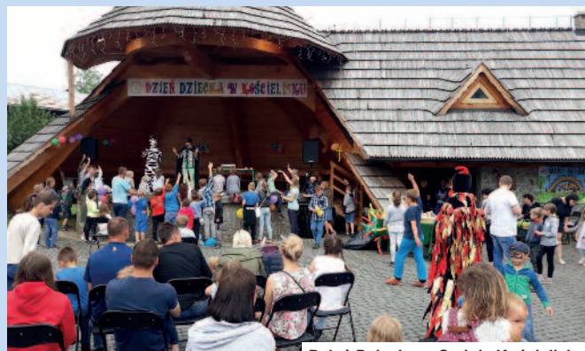
Dzień Dziecka w Gminie Kościelisko 3.06.2018 r.