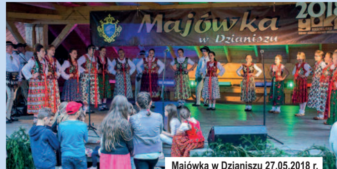
Majówka w Dzianiszcu 27.05.2018 r.