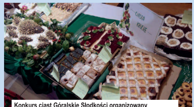
Konkurs ciast Góralskie Słodkości organizowany przez Koło Gospodyń Wiejskich w Kościelisku 23.06.2018 r.