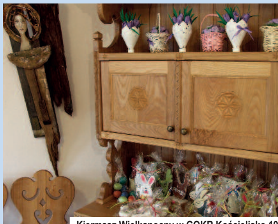
Kiermasz Wielkanocny w GOKR Kościelisko 19-28.03.2018 r.