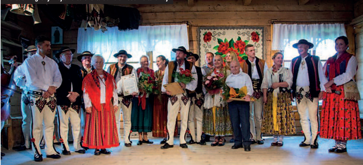
Laureaci Nagrody Wójta za całokształt działalności kulturalnej.

6 maja, podczas Przednówka w Polanach, wręczono Nagrody Wójta za całokształt działalności kulturalnej.