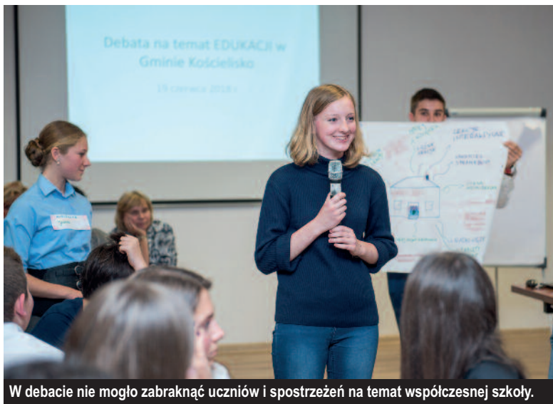
W debacie nie mogło zabraknąć uczniów i sprostowań na temat współczesnej szkoły.

Punktem wyjścia do wspomnianego planu są tzw. „kompetencje kluczowe”, czyli zestaw najważniejszych kompetencji (przy założeniu, że