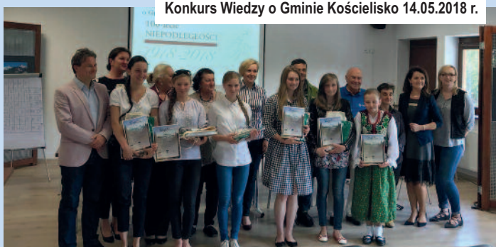
Konkurs Wiedzy o Gminie Kościelisko 14.05.2018 r.